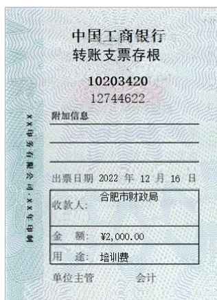
图 2 - 13

(2) 摘要：12月31日，分配工资 200 000 元。其中，生产 A 产品工人工资 56 000 元，生产 B 产品工人工资 84 000 元，车间管理人员工资 10 000 元，行政管理部门人员工资 20 000 元，销售部门人员工资 30 000 元（见表 2 - 2）。