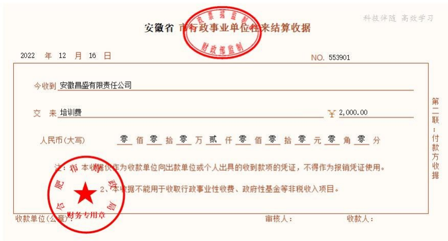
图 2 - 12